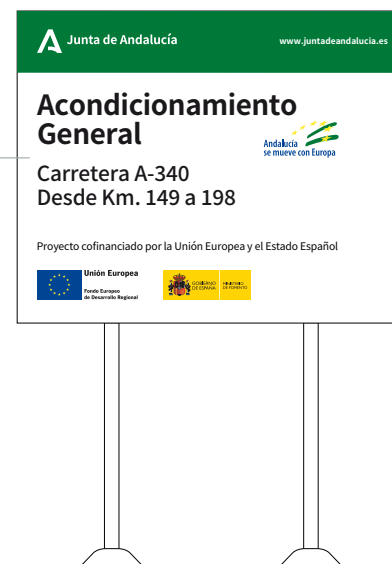
Modelo de obra de carretera